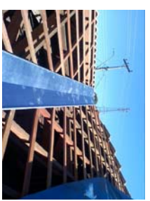
DETALHE RUFO ÁGUA FURTADA