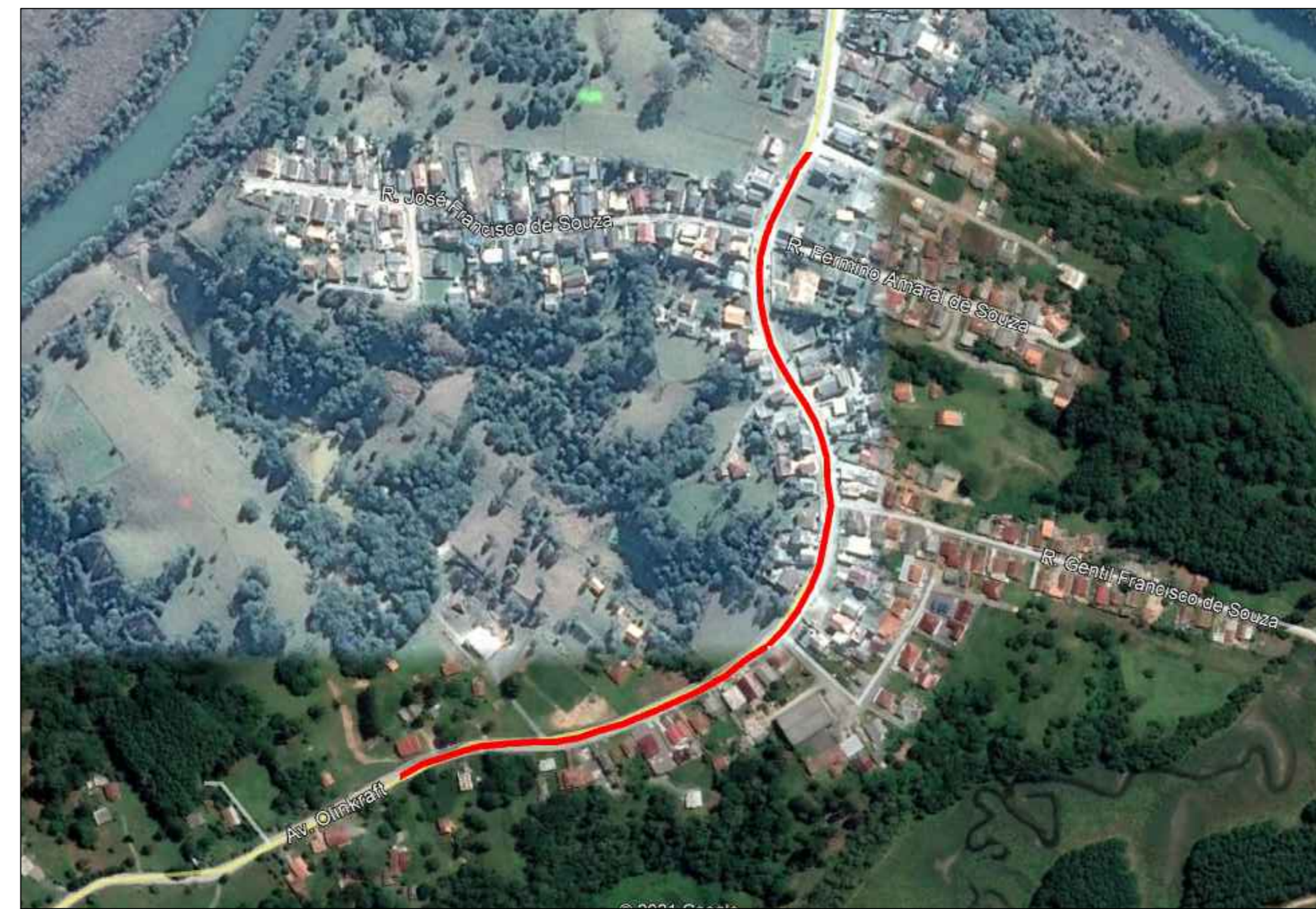
LOCALIZAÇÃO DA AVENIDA BEIRA RIO - 690M